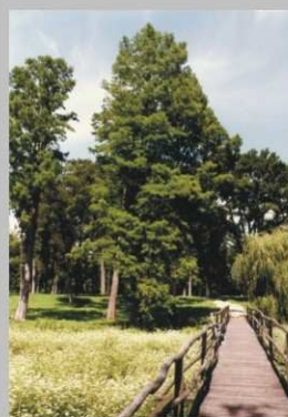
Skupina tisovcov dvojradových