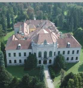
Zámok Eckartsau dnes