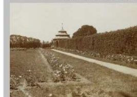
A rózsakert 1910 körül

A platánok csoportjaival szegélyezett Északi parkban , a parkoló mögött áll egy terebélyes szomorú bükk.