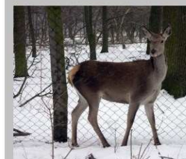
Szelíd szarvas a Lés-erdőben