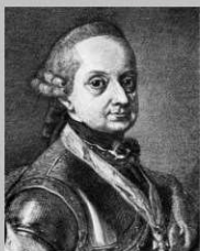
Esterházy I. „Fényes” Miklós herceg