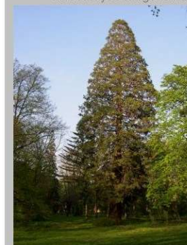
Mamutfenyő az Angolkertben